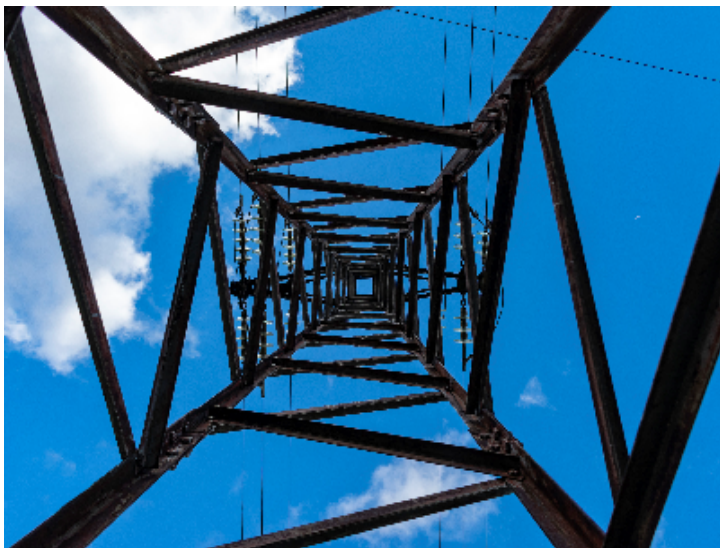
Geometría espacial Miguel Santos Hernáez