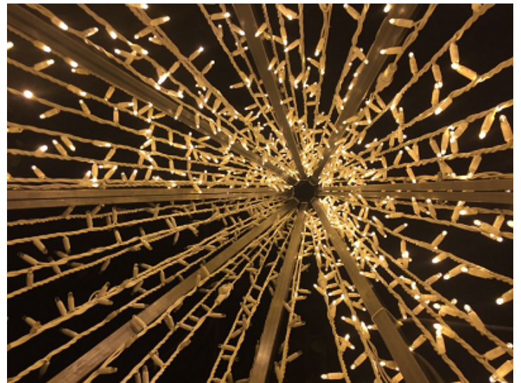
Punto de fuga Sergio Azofra Gaona