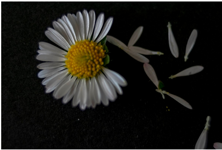
“Fracción de deseos” - Miguel Santos Hernáiz