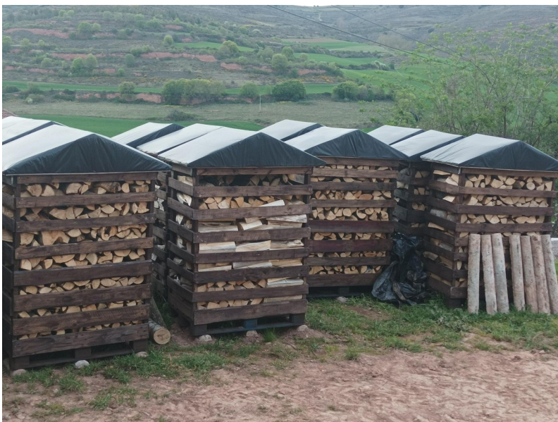
“Geometría rural”