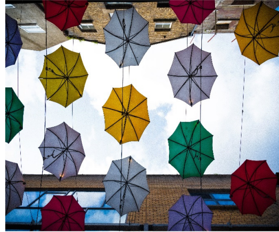
Geometría colgante - Xiara Junchaya (4º B)