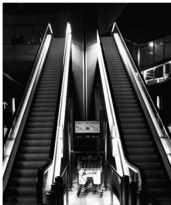
Escaleras paralelas - Valeria Tejeda (1º A)