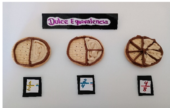
Dulce equivalencia - Isabella Rivero (2º C)